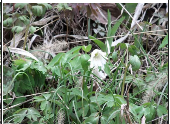
アズマイチゲ