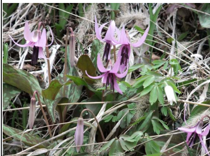
カタクリ