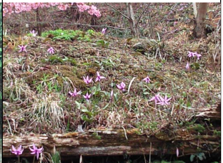
カタクリが一面に広がっていました