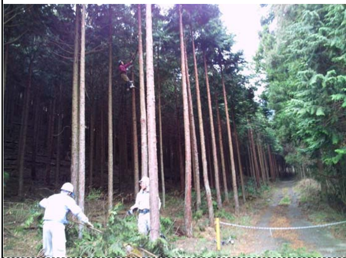
石原さんので終了で～す