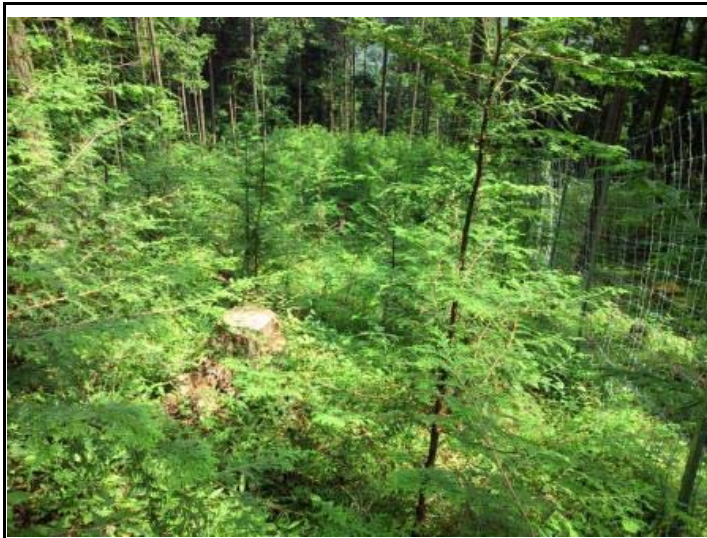
上からも下が見えない