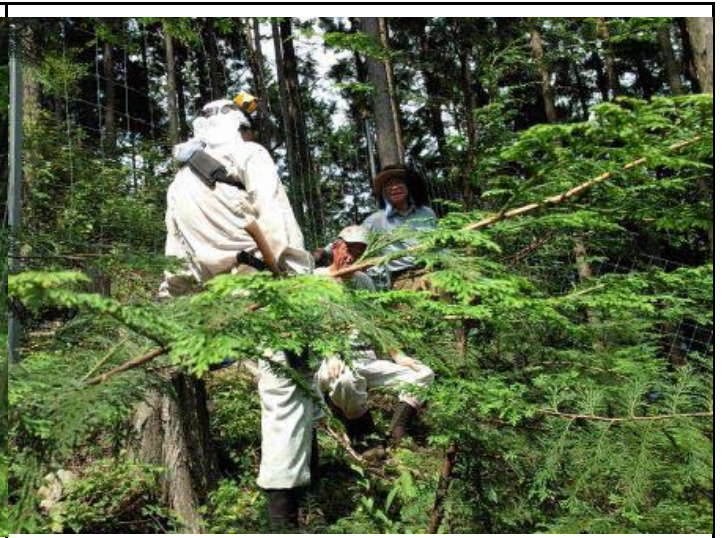
あっという間に終わって談笑中