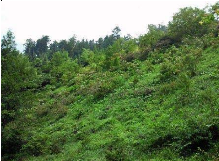
下段：アジサイの土手