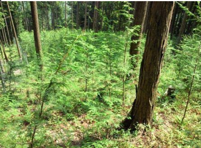
大きくなって上が見えない 草の伸び、ないでしょ