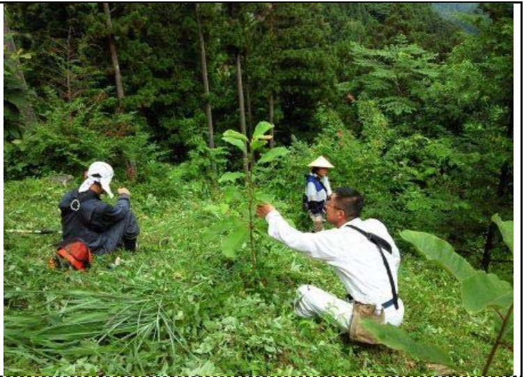
朴の木が何本もよく育っている