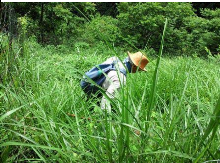
シカ柵 2 作業前

梅雨は天気に翻弄させられます。雨の中になるかと思っていたものの、日差しも時折あるという絶好の下刈り日和となる。～シカ柵1は、春植え(ここが最初)。シカ柵2は、秋植え～ 下から行こう、という事でシカ柵2から始める。渡辺さんは外回りを、五十嵐さんと私で中を刈る。草に覆われてコナラが見えなかったが、刈って行くと成長したコナラにお目にかかることが出来た。1時間ほどかけ終了。日ざしもあって、汗でビショビショになる。シカ柵1も草がいっぱい?..と行くと、それほどでもなかった。周りのオニグルミが大きくなり、今後、日照が気になりになるかも。 おなかもすいてきたが、やり終えてから、ということで柵ナシのところへ。動物達が歩き回っているようで、土が見える。コナラは何処?という感じだった。ここは、下刈りせずこのままで、様子を見ることとする。13時頃終了し、昼食前のおやつに、今が盛りのモミジイチゴを食してから昼食。 用事のある渡辺さんの帰宅を見送り、ふたりで、苗床の草むしりをして終了とした。