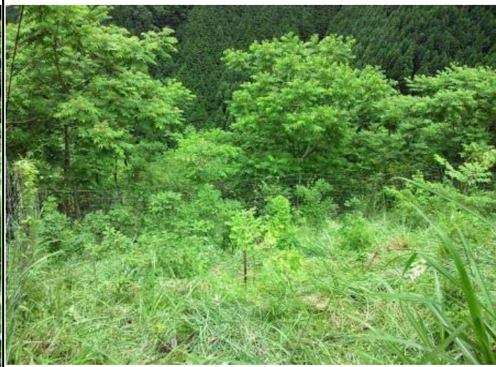
シカ柵 2 作業後