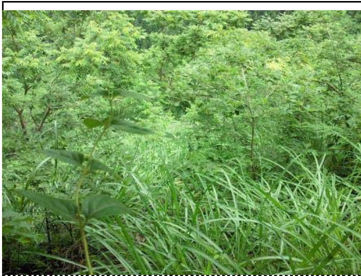
シカ柵 1 作業前