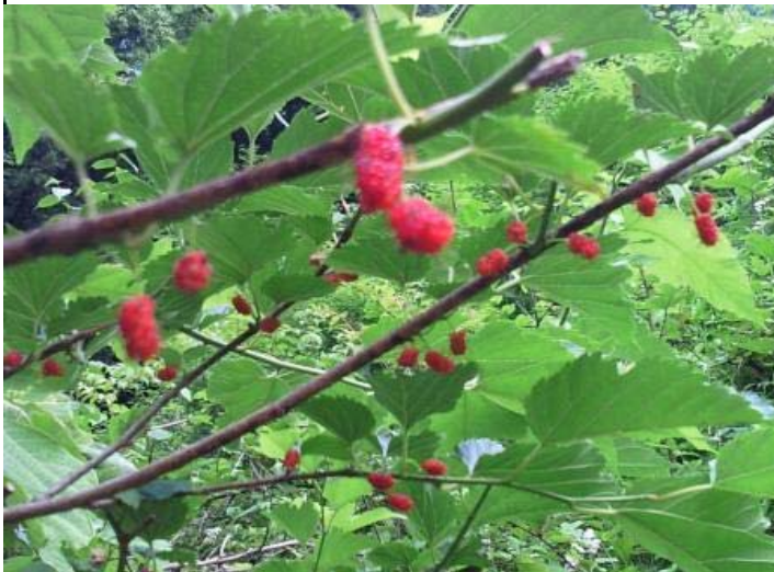
おいしいところを食べた後！