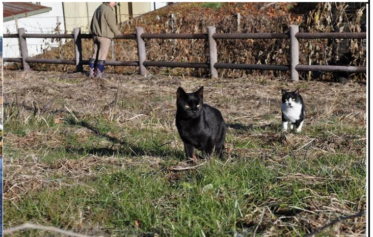
寒い朝です。道路が霜で真っ白、凍っています。