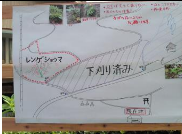
カタクリ会で作った、作業場所の確認図

作業の具体的な様子・内容（写真添付可） 日照りではないものの、じっとりと汗が滲む気候。総勢40名弱で作業は行われる。自治会で、昨年当方で刈っていた下部が終了していたことで、今年は、上部まで行うことができたようだ。作業終了も早めとなり、いつもの昼食は11時頃だった。木が大きくなり、下草の成長もゆるやかになってきたようだった。雑木の除伐をした方がよさそうな込み合った場所もある。コアジサイ(奥多摩アジサイ?)が、大きくなって見栄えする。しかし、中に入らないと見られないので、お披露目できるというのに、と。昼食をご馳走になり、学生寮で片づけし解散するとまもなく、大雨が降ってきた。私1人しばし寮で待機。こんな風に、にわか雨にあいながらの下刈り活動が、以前はよくあったもの。今回は、濡れずに終了できてよかった。前日鳩ノ巣で、ホテル5匹確認しました。