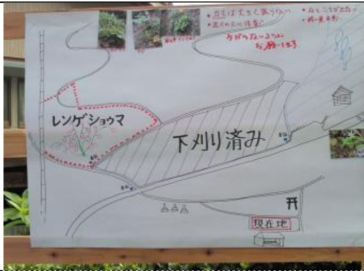
カタクリ会で作った、作業場所の確認図

日照りではないものの、じっとりと汗が滲む気候。 総勢40名弱で作業は行われる。自治会で、昨年当方で刈っていた下部が終了していたことで、今年は、上部まで行うことができたようだ。作業終了も早めとなり、いつもの昼食は11時頃だった。 木が大きくなり、下草の成長もゆるやかになってきたようだった。雑木の除伐をした方がよさそうな込み合った場所もある。コアジサイ(奥多摩アジサイ?)が、大きくなって見栄えする。しかし、中に入らないと見られないので、お披露目できるといいのに、と。 昼食をご馳走になり、学生寮で片づけし解散するとまもなく、大雨が降ってきた。私1人しばし寮で待機。 こんな風に、にわか雨にあいながらの下刈り活動が、以前はよくあったもの。今回は、濡れずに終了できてよかった。 前日鳩ノ巣で、ホテル5匹確認しました。