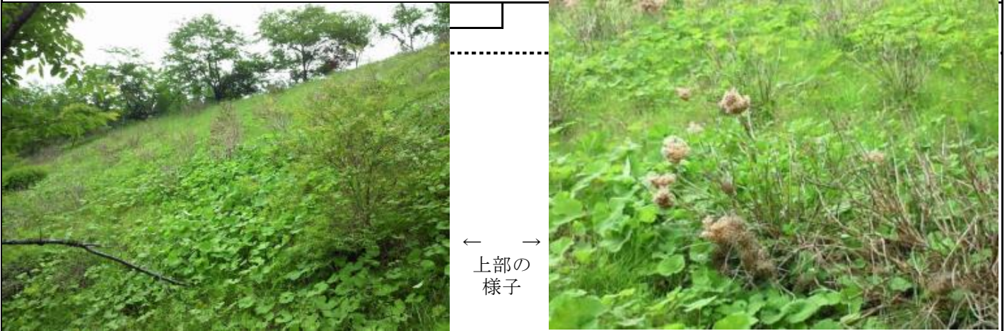
← 上部の様子 →