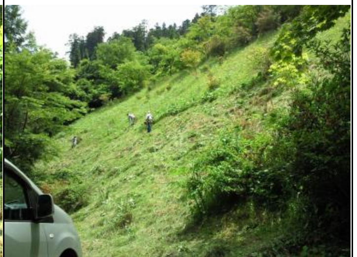
ずいぶん上まで進みました