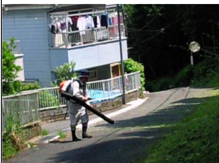
ブロアーはお手の物